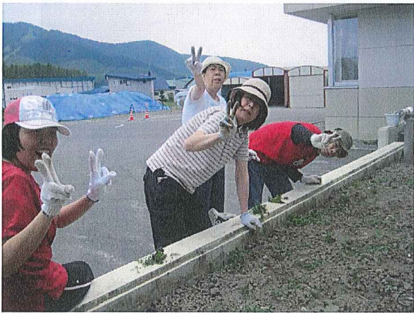
日中活動の1コマ ～印刷班の花壇整備～