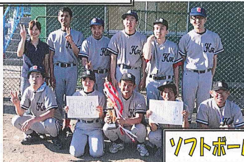
ソフトボール大会 ~祝☆準優勝!!~