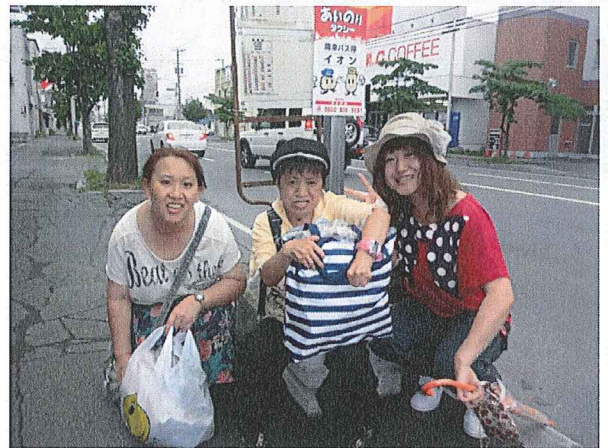
自活訓練者外出 ～帯広にて～