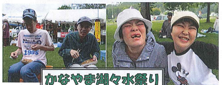
かなやま湖々水祭り