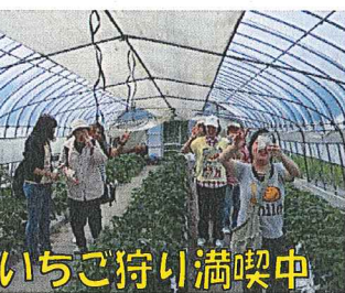
いちご狩り満喫中

昼食は、農園内のレストランでそばやピザ、季節の野菜のアスパラ井など好みのメニューを食べました。特に、「そば」は希少品種のそば粉「ボタン」を一〇〇％使用した手打ち十割そばで、とってもおいしかったです。