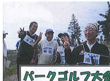
パークゴルフ大会