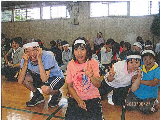
町福祉スポーツ大会での1コマ。 皆さん出番待ちの間も元気一杯です (^.^);