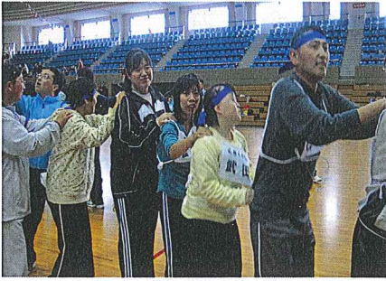
スポーツ交流会(大雪アリーナ)